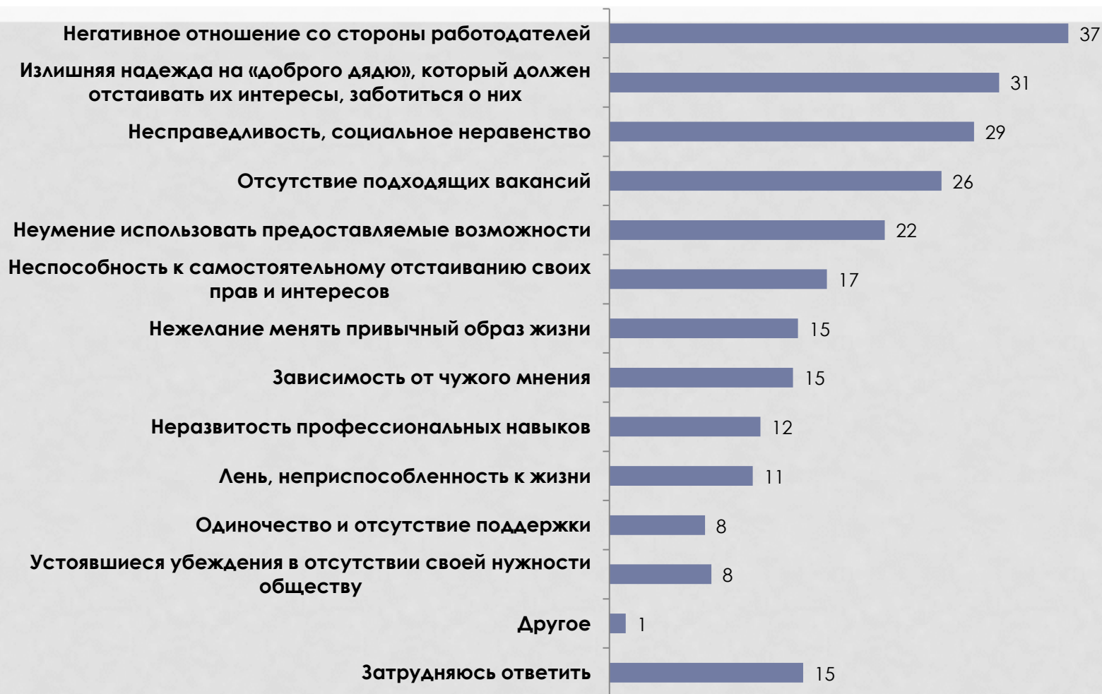
Рис. 1. Распределение ответов на вопрос: «Что мешает многодетным семьям активно включиться в трудовую деятельность?», % от опрошенных